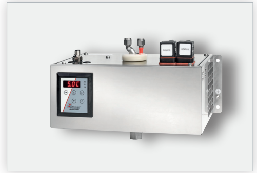
Messgaskühler TC-Standard H 2 / O 2

Dieser Systemaufbau reduziert den Materialmix im Aufbereitungssystem auf ein Minimum, bietet die bestmögliche Nutzungsdauer und gewährleistet unverfälschte Messergebnisse.