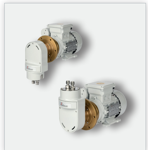
Messgaspumpe P2.4 H_2 Atex

Wie in viele anderen Fällen auch, müssen die Herstellungsprozesse von H_2 analytisch überwacht werden. Dabei steht in erster Linie die Einhaltung der UEG und der SIL Vorgaben im Fokus. In allen Herstellungsverfahren ist die extraktive Gasanalytik dafür die bevorzugte Analysenmethode. Dabei wird vor Eintritt des Messgases in den Analysator die Restfeuchte entfernt um die Messzelle zu schützen und die Messwerte nicht zu verfälschen. Basierend auf unserer jahrzehntelangen Erfahrung in der Ausrüstung und Konzeptionierung von Analysensystemen in der Gasanalytik schlagen wir vor, für diese Applikationen ein druckbeaufschlagtes extraktives Aufbereitungssystem einzusetzen. Dies ist prinzipiell wie folgt aufgebaut: