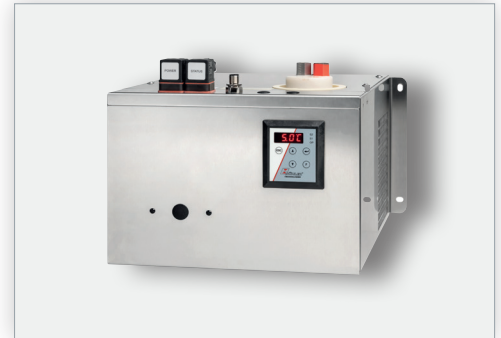
Messgaskühler RC1.1 H 2 / O 2