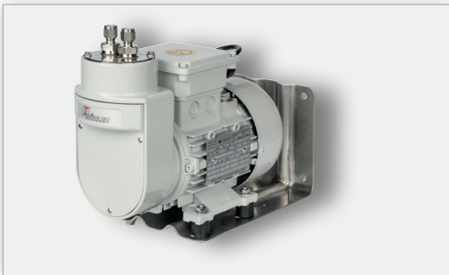
Messgaspumpe P2.2 O_2 Atex

vorliegt, muss es aus seinen Trägern herausgelöst werden. Dies erfolgt z.B. bei Wasser ( H_2O ) durch Elektrolyse- kommt der Strom dabei aus erneuerbaren Quellen spricht man von ‚grünem‘ Wasserstoff- oder bei Methan ( CH_4 ) - dem Hauptbestandteil von Erdgas- durch Dampfreformation oder Pyrolyse. Bei der Reformation entsteht als Nebenprodukt CO_2 (blauer Wasserstoff) und der Pyrolyse CO (türkiser Wasserstoff). Beide Stoffe können als Rohstoffe weiterverarbeitet oder gelagert (CCS) werden.