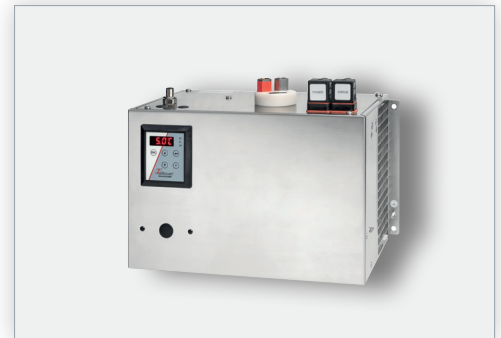
Messgaskühler TC-Midi H 2 / O 2